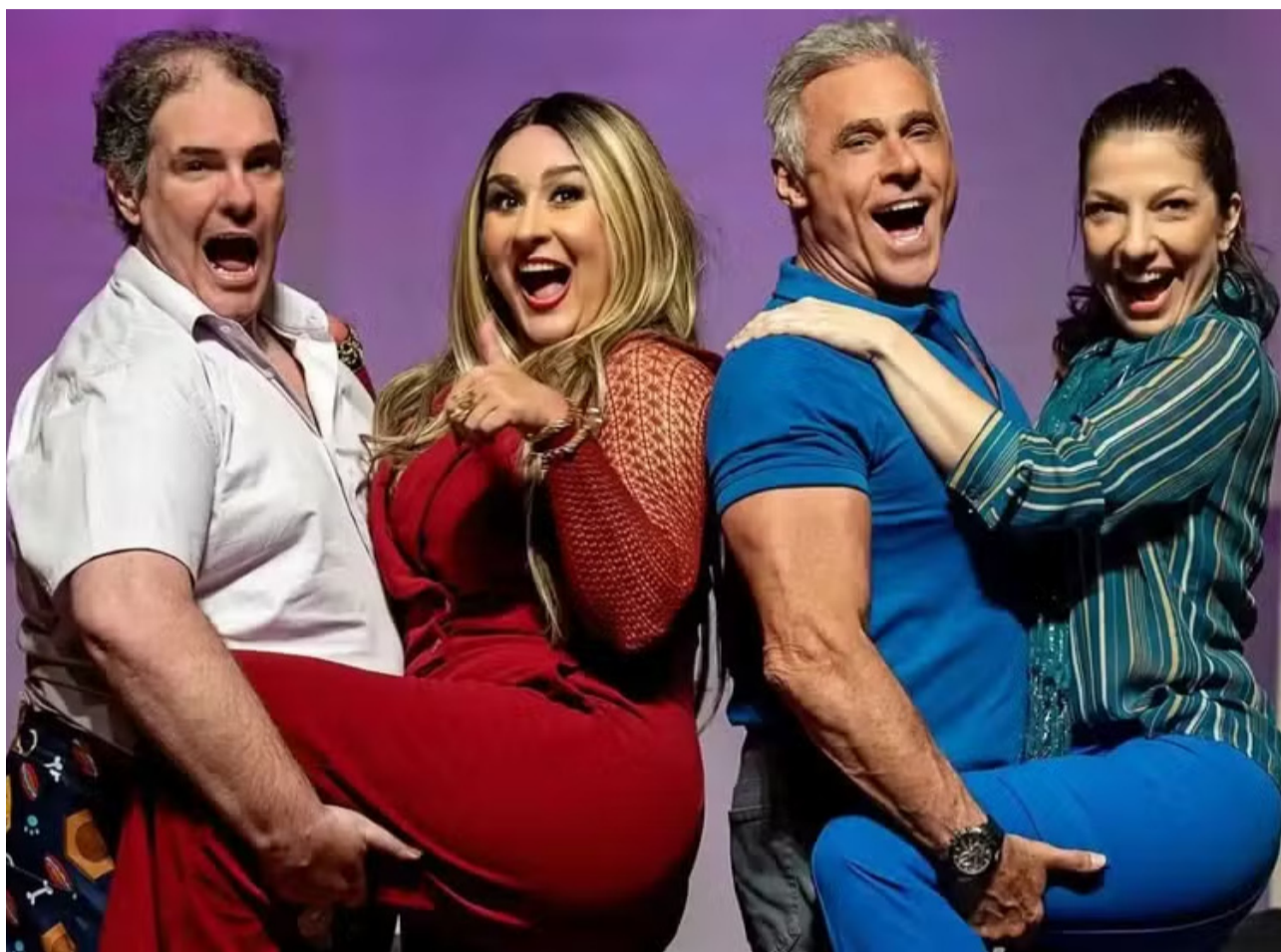
Comédia ‘Troca-Troca’ com Oscar Magrini será apresentada neste sábado em Santos