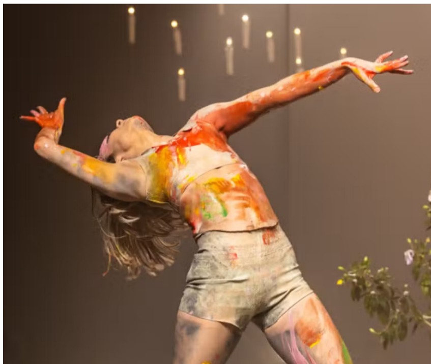
Cinza com Sol’ acontece no Sesi de Santos