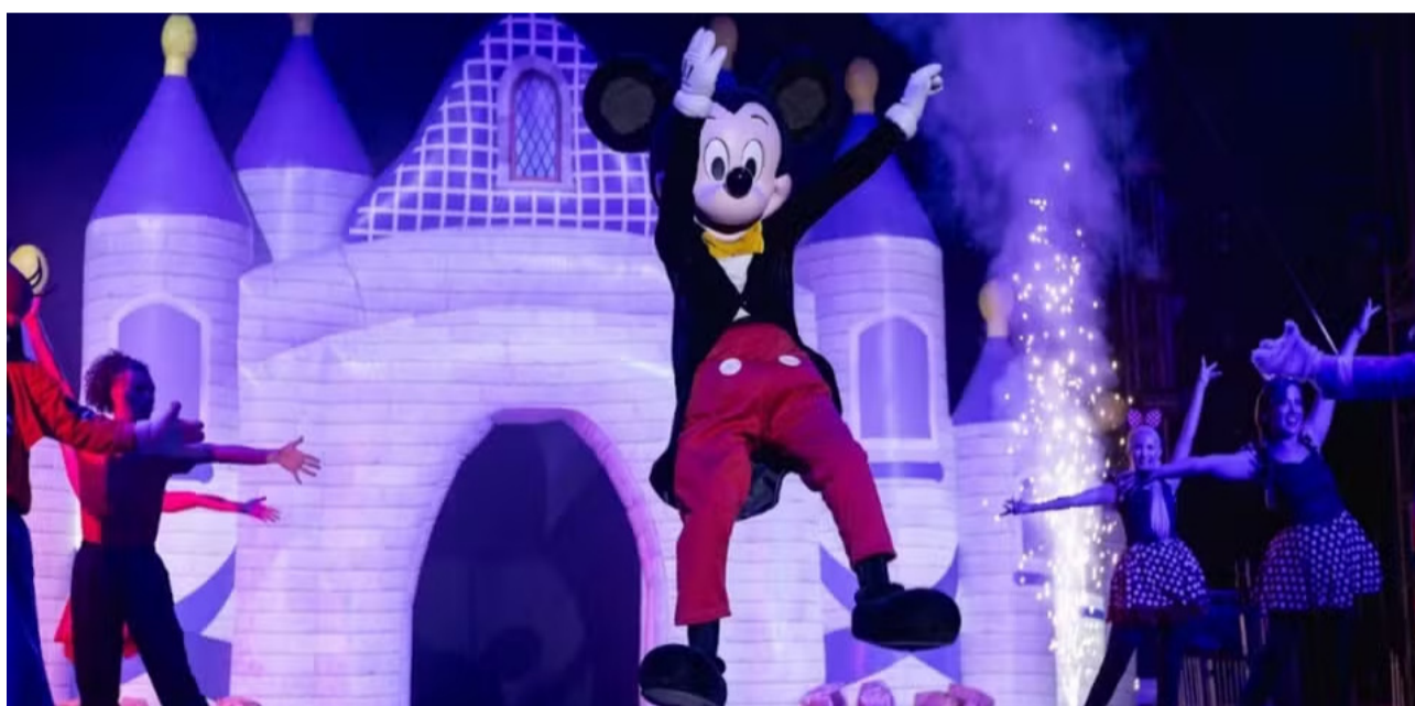
Circo Di Napoli traz o espetáculo Disney Magic Show para São Vicente