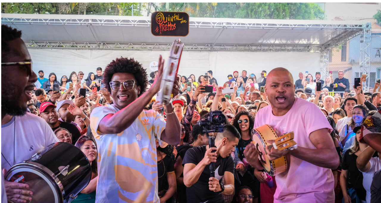
Quintal dos Prettos apresenta roda de samba em São Vicente

América' compõem o repertório escolhido para tocar o coração do público.