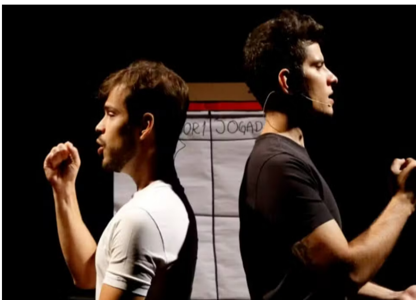
Peça teatral InconscienteMente