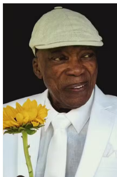
Tributo a Milton Nascimento