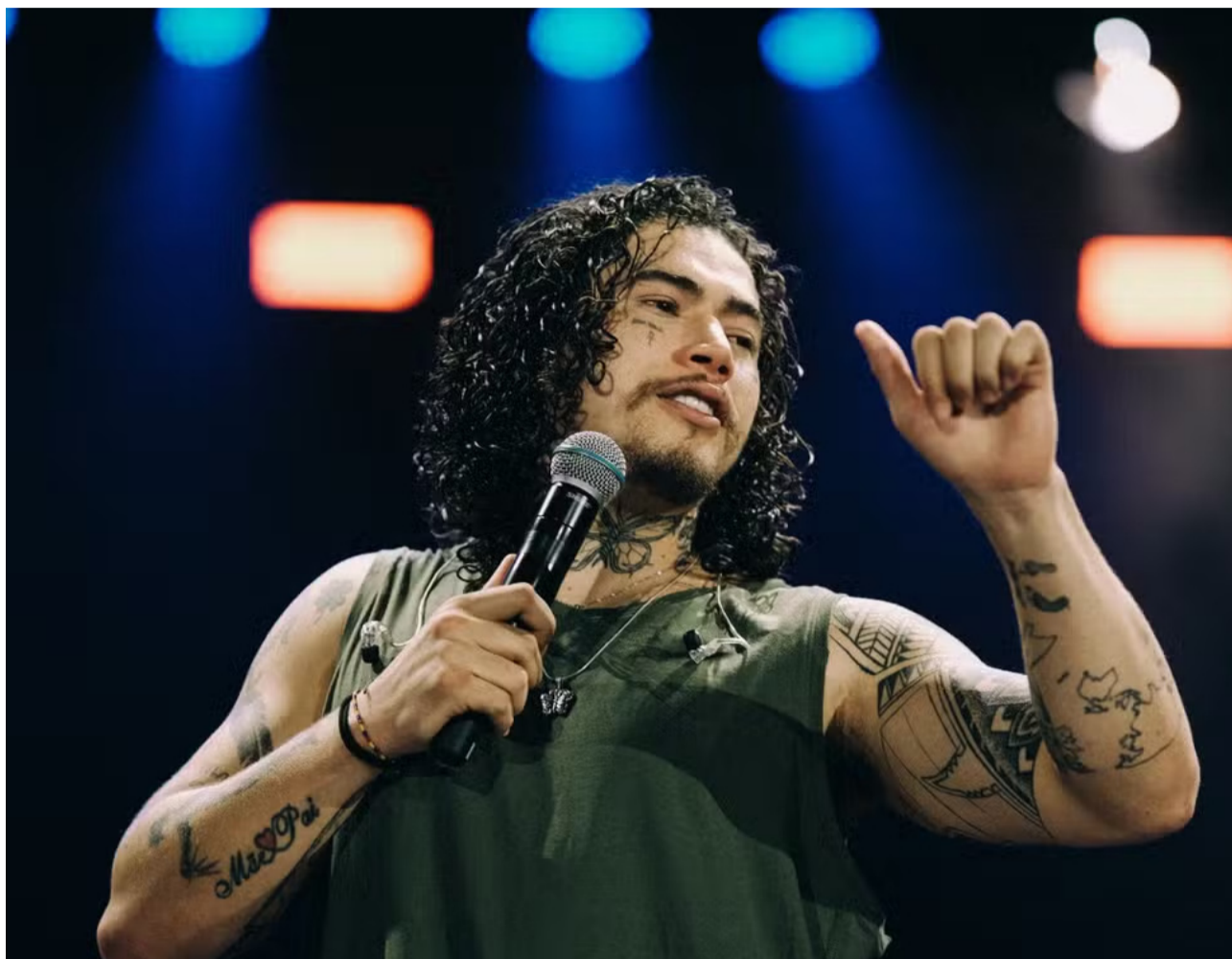
Whindersson Nunes apresenta novo espetáculo em Santos