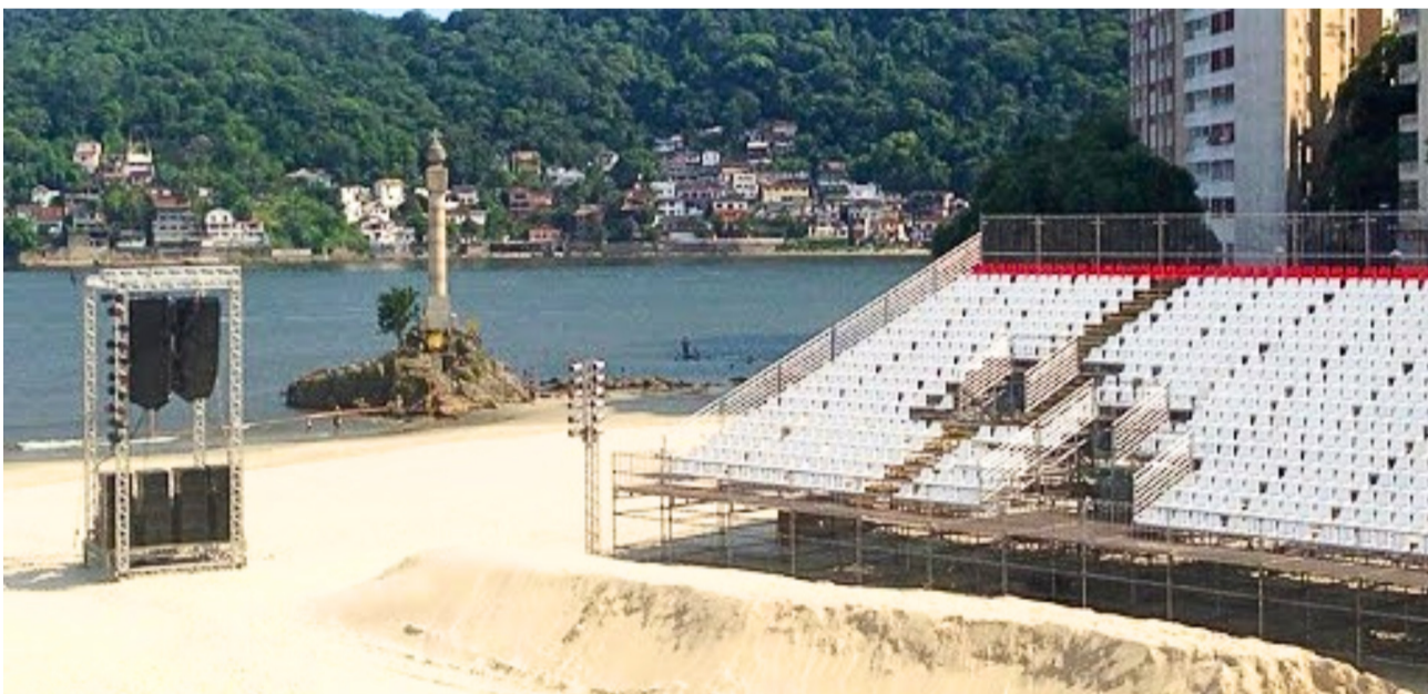
Praia do Gonzaguinha é palco da Encenação da fundação da Vila de São Vicente