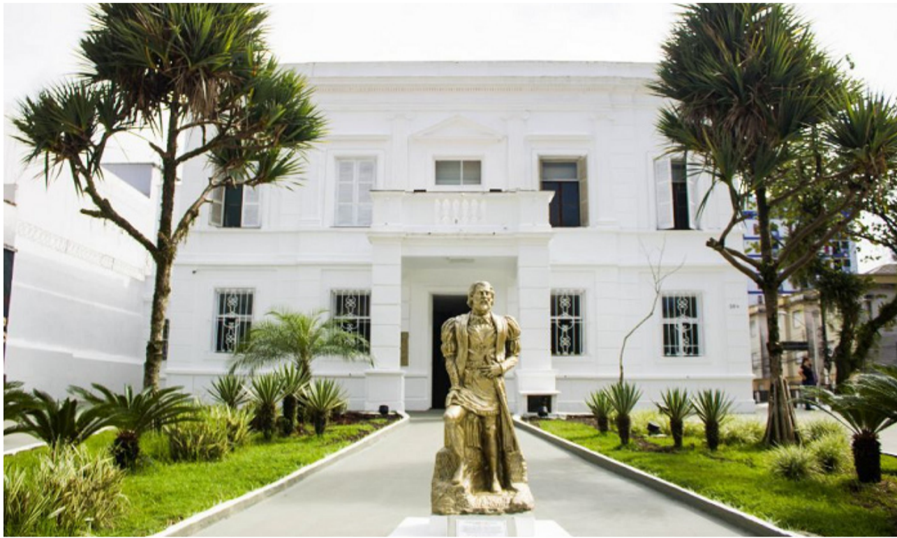
Setor é o responsável por receber as demandas da população referentes aos serviços públicos

As principais demandas registradas pela Ouvidoria Municipal refletem a atenção da população com o bem-estar da Cidade, destacando questões como comércio irregular (194), zeladoria (128), atendimento nas unidades de saúde (82), iluminação pública (60), poluição sonora (58)