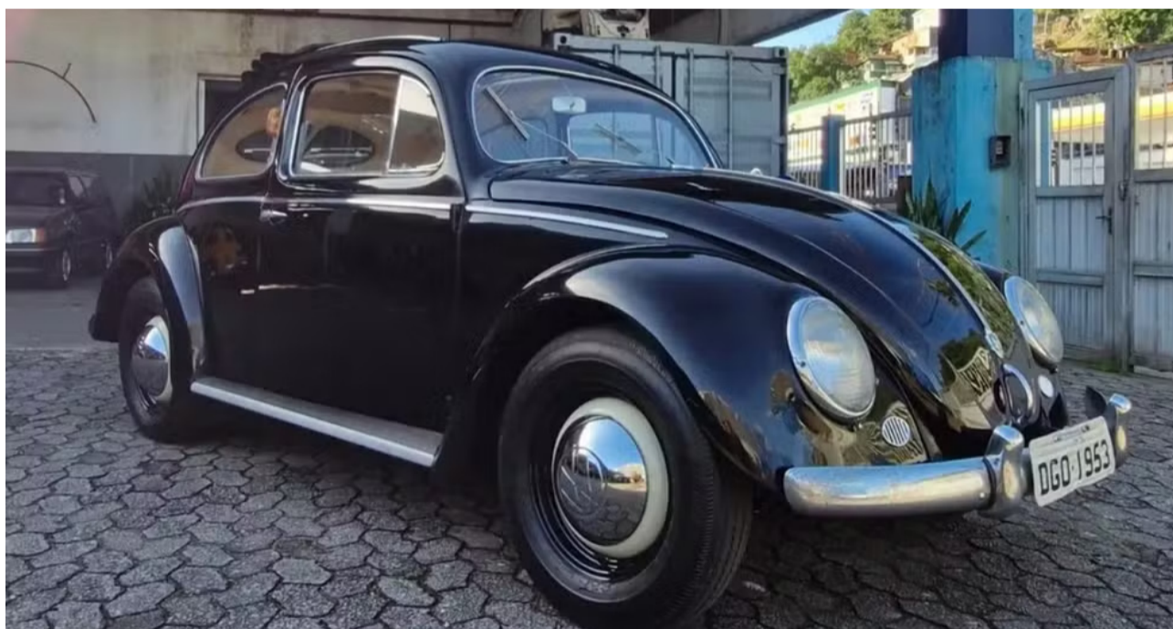
A exposição 'Fuscmania' reúne 10 modelos clássicos do veículo no Praiamar Shopping