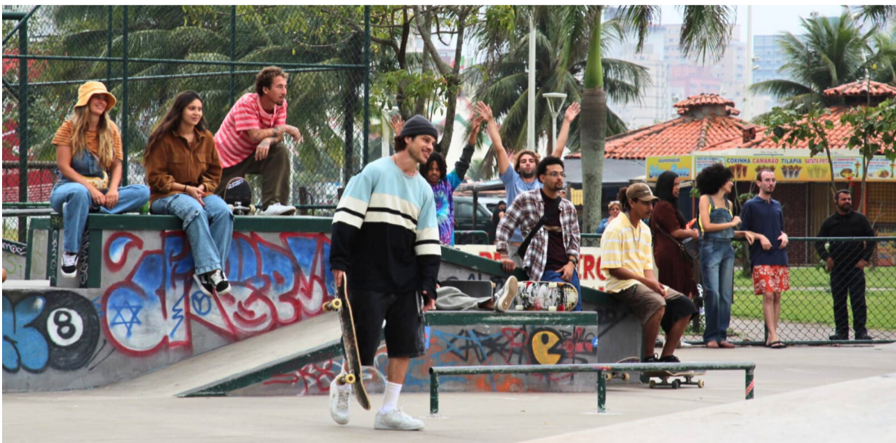
O ator José Loreto gravou cenas da cinebiografia de Chorão no Itararé