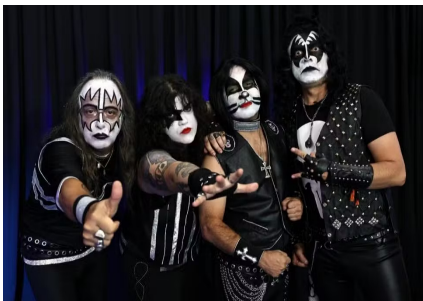
O projeto 'Concha Rock Santos' apresenta tributo ao Kiss