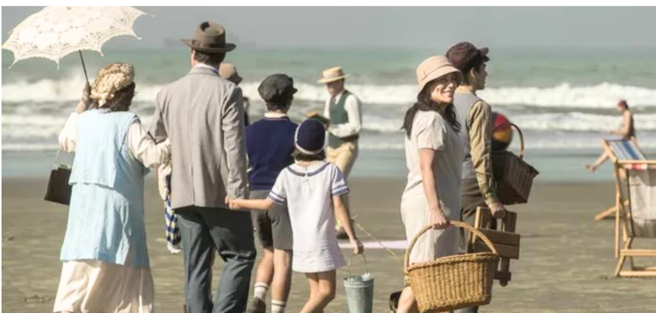
Praia do Itararé foi cenário das gravações da novela Eramos Seis